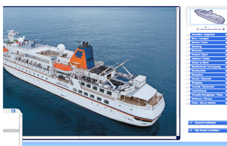
ars navigandi viewer im Einsatz: CruiseViewer