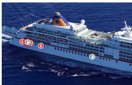
Anzeige der Kartenobjekte