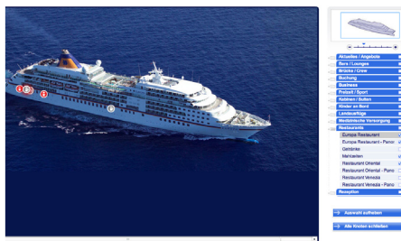
Auswahl innerhalb des Kartenmenüs