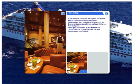
Anzeige von umfangreichen Text und Bilddaten